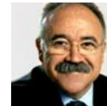
Josep Lluís Carod-Rovira