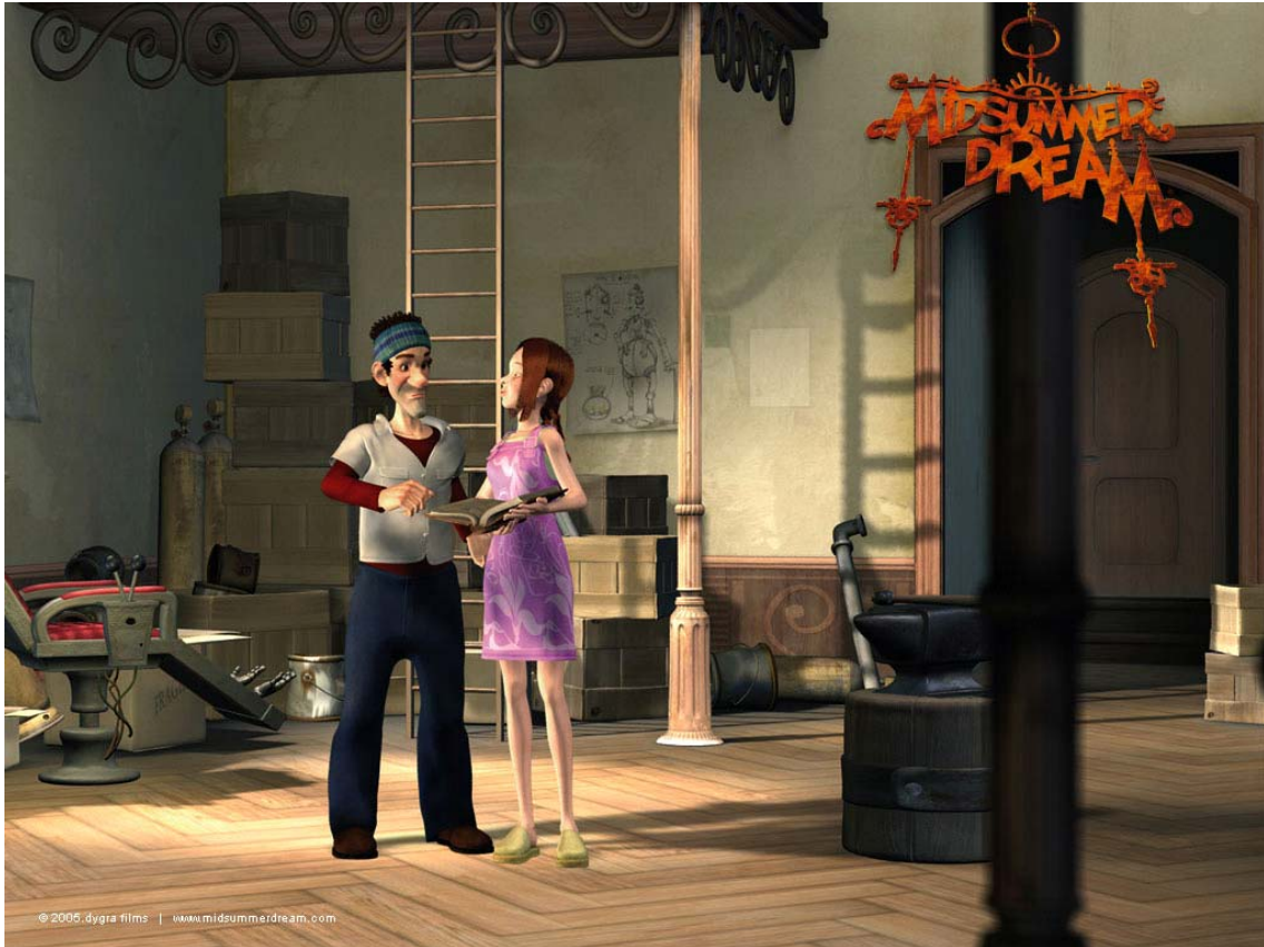
Figura 2: Fotograma de la última película de DYGRA Films para la cual se ha desarrollado el proyecto: El sueño de una noche de San Juan .